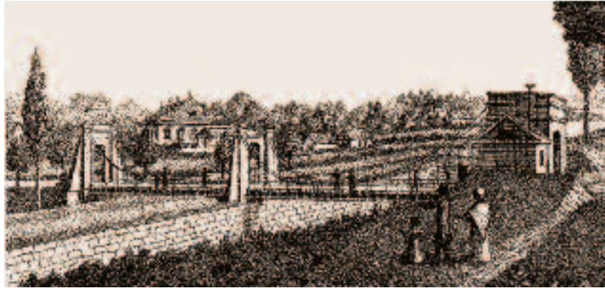
Le « pont en fil de fer » des Pâquis, à Genève, l'un des premiers ponts suspendus d'Europe.

Les panaches de fumée du Winkelried, construit par une société d'actionnaires créée par M.-A. Demole, cohabitent désormais avec les voiles latines des grandes barques lacustres.