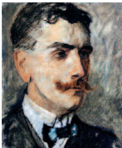
Ferdinand de Saussure, homme de lettres considéré comme le fondateur de la linguistique moderne. Plusieurs membres de sa famille sont devenus associés de Pictet & Cie.

mondiale dans un marasme aux conséquences douloureuses. Dès 1931, les effets de la crise commencent aussi à se faire sentir à Genève. Les clients traditionnels de l'horlogerie, des fabriques de machines ou de l'hôtellerie se font de plus en plus rares. Chômage et tensions sociales sont les composants de ce «temps des passions» politiques. Genève s'engage dans trois années de gouvernement socialiste dirigé par Léon Nicole. Symbole politique et économique: le 11 juillet 1931, la Banque de Genève ferme ses guichets, précipitée dans une faillite aux relents de scandale.