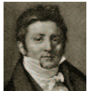
Jacob-Michel-François de Candolle. Il s'associe avec Jacques-Henry Mallet. Leur société est à l'origine de Pictet & Cie.

Les dossiers des clients, dans cette première moitié du XIX e siècle, contiennent non seulement des placements traditionnels comme des obligations et des actions, mais encore des billets de loterie (de Vienne ou de Naples) et des tontines (d'Irlande, de Turin ou d'Orléans). Parmi les obligations, mentionnons le 2½% France, le 2½% Dette intégrale de Hollande, le 4% Ville de Paris ou encore le 5% Emprunt russe. Au nombre des actions, citons celles du «pont en fil de fer» des Pâquis, l'un des premiers ponts suspendus d'Europe, celles du navire Le George au Havre, ou encore celles du bateau à vapeur hollandais Le Rotterdam .