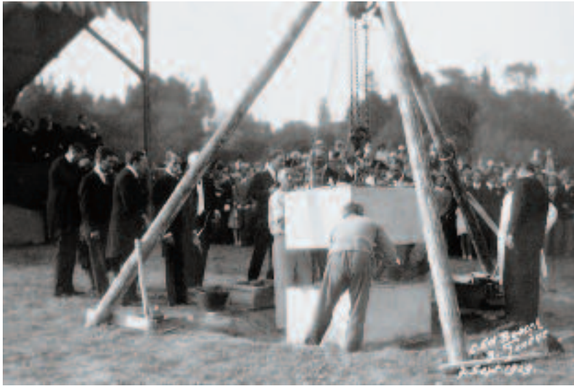
Pose des premières pierres du nouveau bâtiment de la Société des Nations à Genève, à laquelle succédera l'Organi- sation des Nations unies.