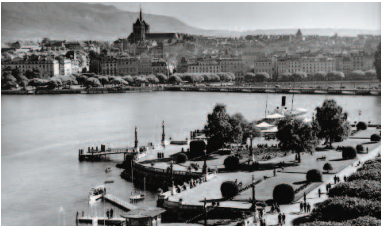
Vue de la rade de Genève, prise après la guerre.

De 1920 à 1950, le métier de banquier privé est difficile. Les crises politiques et économiques se succèdent les unes aux autres, entraînant un fort ralentissement des affaires et une chute des bénéfices. Pendant la Deuxième Guerre mondiale, les capitaux investis à l'étranger sont bloqués et le contact avec une partie importante de la clientèle est rompu.