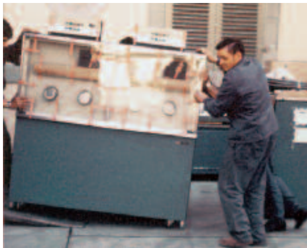
Le premier ordinateur de Pictet & Cie.

C'est en 1968 qu'entre en fonction le premier système informatique chez Pictet & Cie, basé sur un ordinateur central IBM 360, modèle 20.