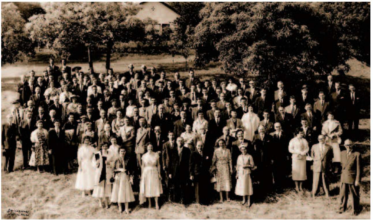
En 1955, Pictet & Cie fête son cent cinquantième anniversaire. Elle compte alors plus de cent quarante collaborateurs.