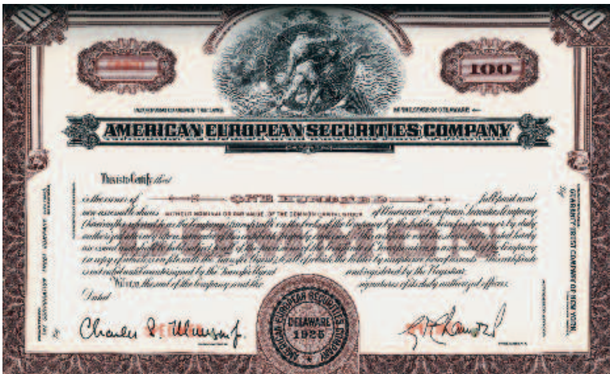
Un papier-valeur de l'American European Securities Company, qui existe aujourd'hui sous le nom de Amerosec.

au Mexique peuvent être considérées comme des précurseurs des fonds de placement.