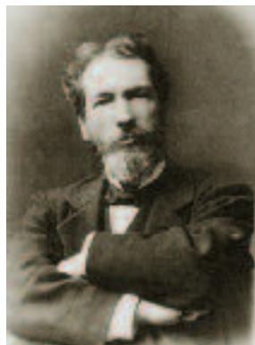
Raoul Pictet (1846-1929), physicien de renom.

Le nom Pictet est présent à l'exposition nationale suisse qui se déroule en 1896 à Genève.