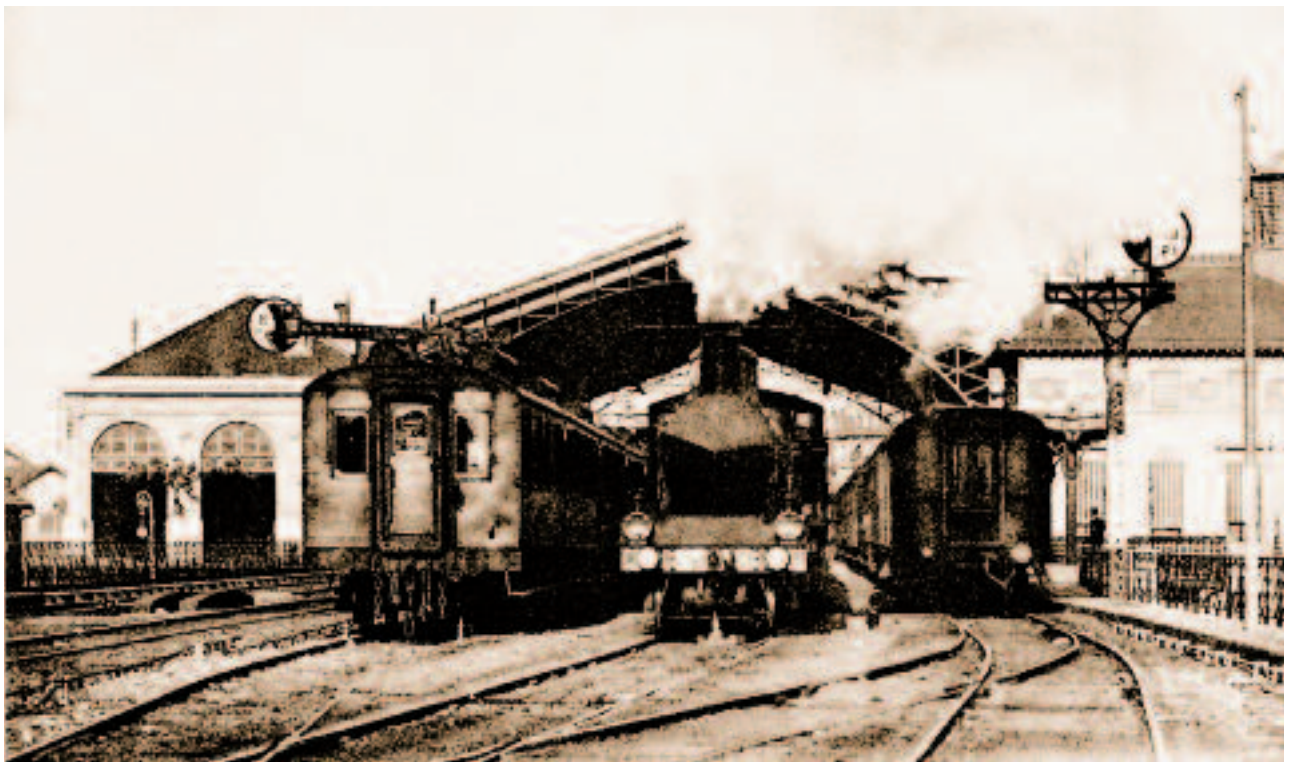
La gare de Cornavin, à Genève. Départ en direction de la France.