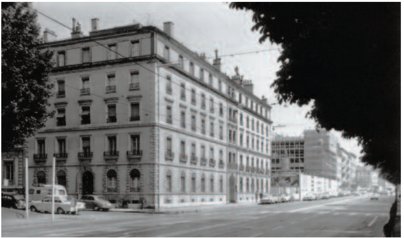
Le boulevard Georges-Favon avant la construction du nouveau siège de Pictet & Cie.