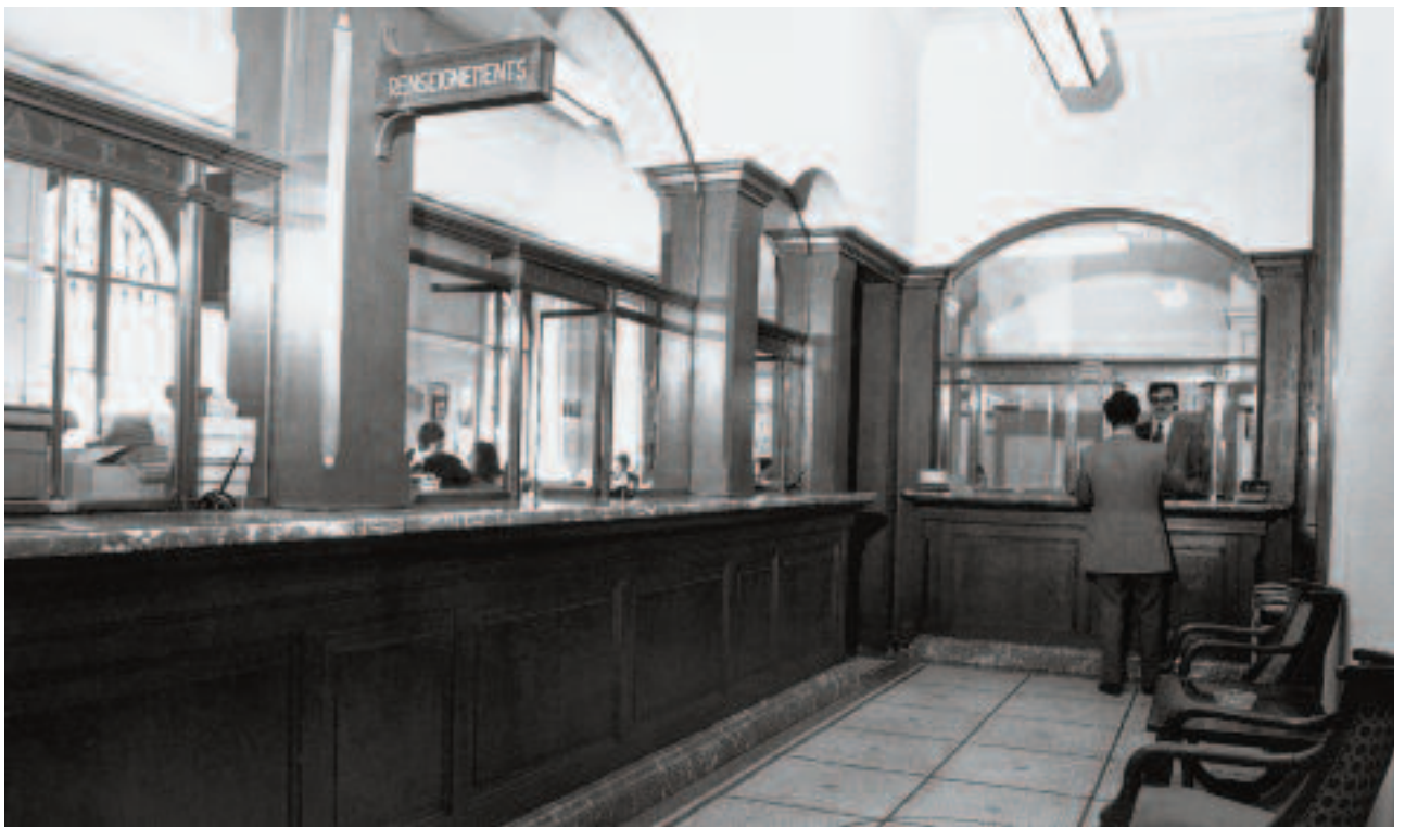
Le hall principal de la Banque, 10 rue Diday.