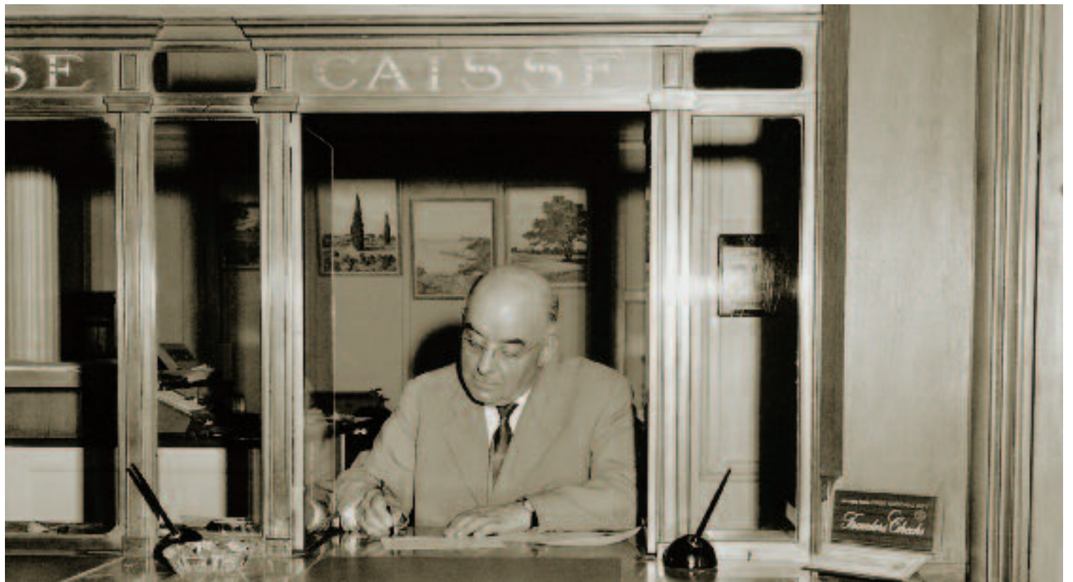
En 1926, la Banque déménage au numéro 6 de la rue Diday.