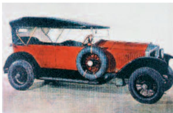
L'automobile Piccard-Pictet, connue sous le nom de Pic-Pic , dont il reste aujourd'hui quelques exemplaires dans le monde.

Les Ateliers Piccard, Pictet & Cie, ancêtre des Ateliers des Charmilles, s'engage dans la fabrication d'appareils de chauffage, de turbines hydrauliques, et dans la construction des automobiles Pic-Pic , qui participent à la renommée industrielle helvétique au début du XX e siècle.